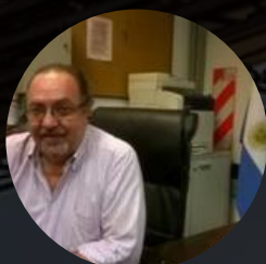
Por Ing. Jorge Teodoro

El Estado como toda organización cuenta también con personal altamente capacitado en algunas funciones, tomemos como ejemplos CONICET, ARSAT o INVAP. El tema es si como organización el Estado es capaz de utilizar en provecho del país estas capacidades en su máxima expresión o bien si esta capacidad potencial se encuentra atada por conceptos que deberían ya haber sido superados.