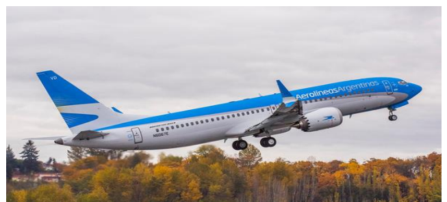
Boeing 737 MAX-8 de Aerolíneas Argentinas en la fabrica de Boeing en Seattle.

pasar por Buenos Aires, generando movilidad interna a muy bajo costo, optimizando tiempos de traslado. A modo de ejemplo, en 2015 solo 25 vuelos no pasaban por Buenos Aires, numero creció a 41 vuelos en 2018 generando un mayor movimiento comercial y de negocios en muchas ciudades del interior y todo lo que ello trae aparejado en las economías regionales. Una política que permitió democratizar los cielos, haciendo que cerca de 1 millón de personas hayan tenido durante 2018 la posibilidad de viajar a precios y tarifas Low Cost (para mas de la mitad de ellas fue su primera vez en un avión ), generando asimismo nuevas oportunidades de puestos de trabajo directos e indirectos vinculados a la actividad aerocomercial, poniendo en valor zonas aledañas al Aeropuerto de El Palomar que fueron creciendo al compas de todo el intenso movimiento comercial generado en la zona. Un Aeropuerto clausurado por la ideología, so pretexto de no cumplir las condiciones de seguridad sanitaria que el COVID-19 requiere , en una decisión orientada a generar mayores costos operativos a las low-cost obligándolas a operar desde el Aeropuerto Internacional de Ezeiza con una estructura de costos operativos mucho mayores con la única finalidad de desalentarlas competitivamente para expandir el monopolio de Aerolíneas Argentinas engrosando una caja históricamente deficitaria sostenida por años con los fondos públicos de todos los ciudadanos.