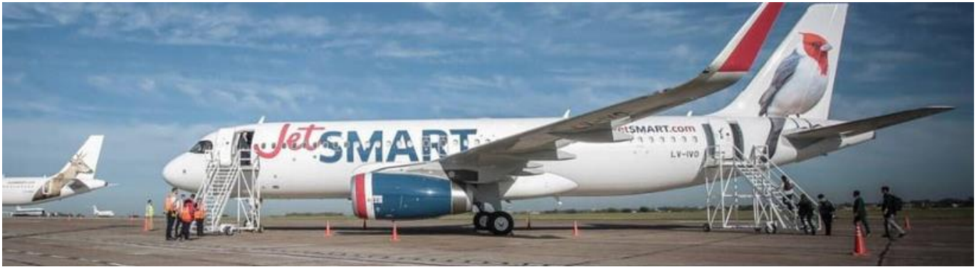
Airbus A320 de Jetsmart en el aeropuerto de El Palomar

Y de ese pasado no tan lejano de crecimiento, mas allá del derrumbe de la actividad aerocomercial producto del COVID-19, a un presente donde Norwegian y Latam dejaron de volar, Andes recién comenzará a operar a mediados del mes próximo después de mas de un año de inactividad. Hoy sola la chilena Jet Smart y junto con Flybondi (con una sola aeronave) son la única competencia de Aerolíneas Argentinas con tan solo 11 vuelos cada una a distintos destinos del país.