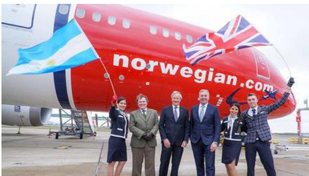
Boeing 787-9 de Norwegian en el Aeropuerto Internacional de Ezeiza.

Sin dudas 2018 fue el auge de la aviación comercial en Argentina, con la apertura en Febrero de 2018 del Aeropuerto de El Palomar sumado a la llegada de las Low Cost Avianca, Flybondi, Jet Smart y Norwegian que permitieron incrementar en 1,8 Millones los asientos disponibles.