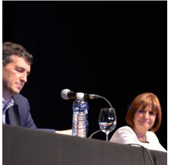
Presentación del libro "Guerra sin cuartel"

La mejor síntesis de una brillante jornada.