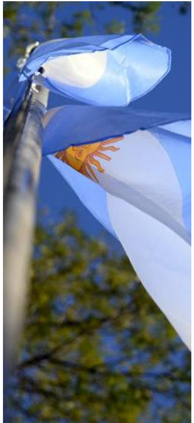
Bandera de la República Argentina

solo controle, pero es importante resaltar que Argentina a lo largo de los años no ha logrado consolidar un modelo de país firme con proyectos a largo plazo. Estos giros bruscos en la dirección del país son un reflejo de que todavía falta un largo recorrido de maduración para dejar peleas internas que nada suman al desarrollo y no permiten generar condiciones de confiabilidad ni mucho menos de progreso mirando a las décadas sobrevinientes.