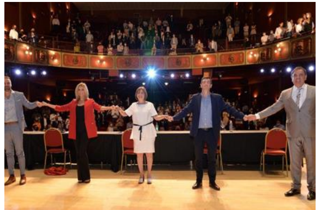
La presentación contó con casi 300 asistentes quienes cumplieron con todos los protocolos