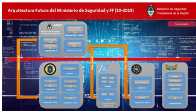
Exadata®, Exalytics®, Exalogic®, Data Guard® ORACLE Corp

Se inició la migración de los distintos Data Centre, total o parcialmente, al Data Centre de ARSAT que tiene muchas mejores condiciones que los propios y en el cual también se garantizaba una operación del equipamiento. El paso siguiente era, y aún faltaban vencer resistencias, un centro único con capacidad de procesamiento y almacenamiento para toda la jurisdicción con virtualización para cada fuerza y el Ministerio pero también con áreas comunes, logrando un ahorro importante de equipos, licenciamiento, operaciones, energía, nivelación de sistemas y mantenimientos.