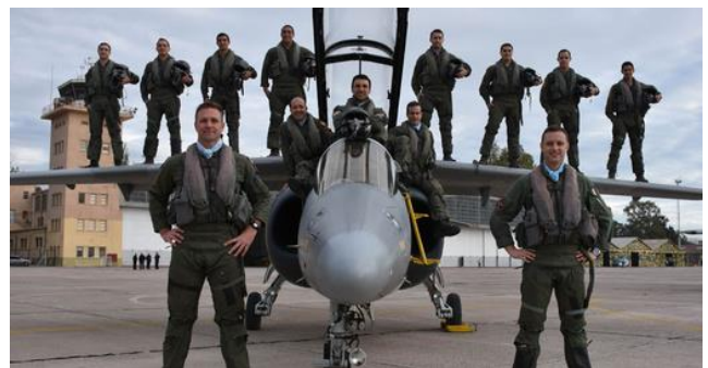
Pilotos de la Fuerza Aérea Argentina

Con miras a 2021, asistimos a un nuevo paso atrás de este gobierno que, bajo la promesa de un presupuesto escaso e ideas de la 2da guerra, inicia un ciclo de planeamiento estratégico que servirá para entretener académicamente a mandos castrenses y discutir la modernización del arco y la flecha en un mundo en el que la Defensa requiere de inversión y tecnología. La sociedad ha superado lo que la política mantiene aún como bandera divisoria del pasado. La falta de coraje para avanzar en los cambios que la misma ley contempla y la incapacidad de recrear un dialogo político sincero nos lleva a seguir sosteniendo algo que sabemos que no funciona y al que se maquilla anualmente.